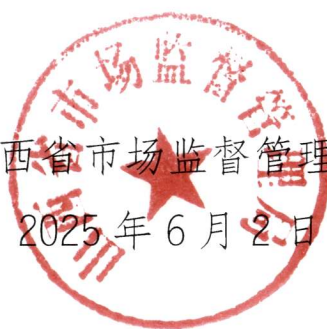
山西省市场监督管理局