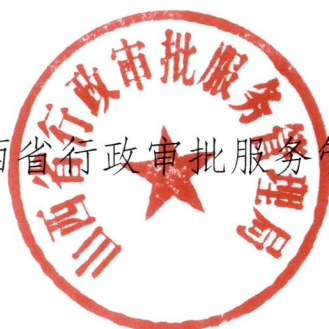
山西省行政审批服务管理局